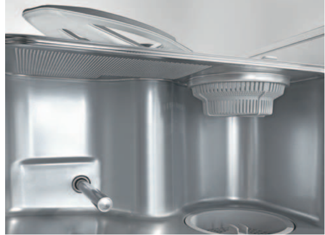
Zij-aanzicht van het interieur van de tank